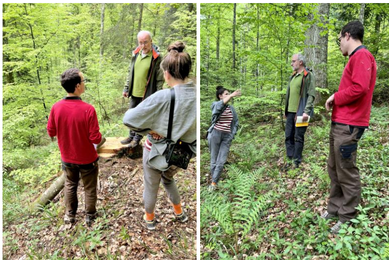
Audit sur le terrain : visite de coupes et de peuplements

Quant à la commune de la Grande Béroche, elle aurait dû être auditée le 11 mai 2022. Celui-ci a dû être reporté à plus tard dans l'année.